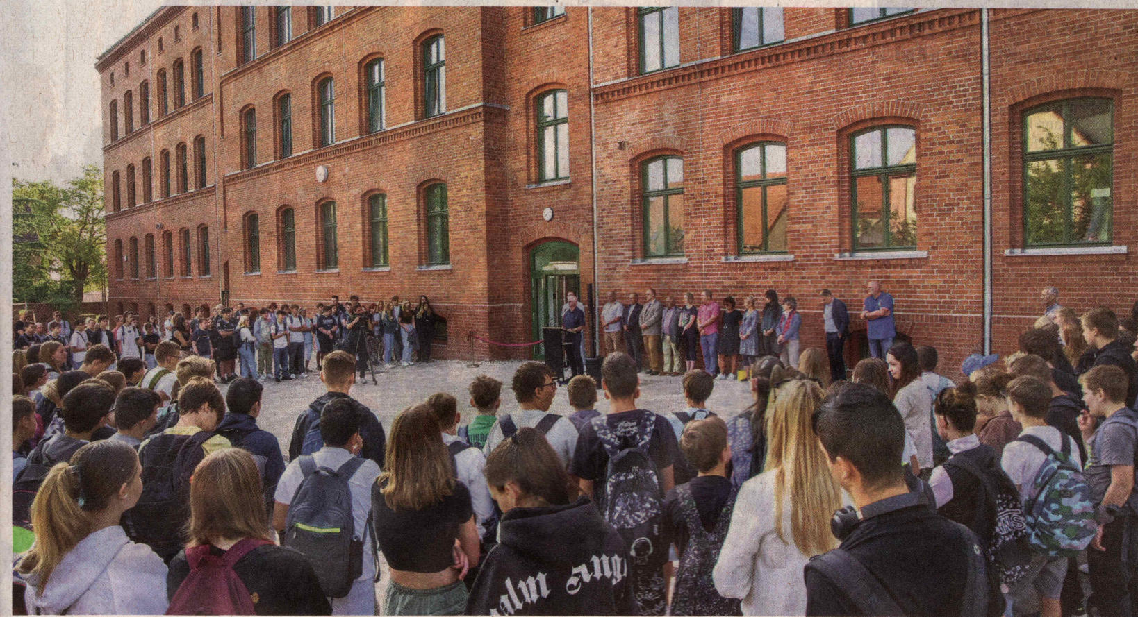
Anlass für den zweiten „Schulhof-Treff“: Nach jahrelanger Sanierung konnte auch Haus 1 der Sekundarschule Roßlau in Betrieb genommen werden.

Klassen der Sekundarschule Roßlau sind von der Biethen in die Goethestraße umgezogen. Nach neun Jahren Pause bekommt der sanierte Klinkerbau jetzt seine Schulkingel zurück.